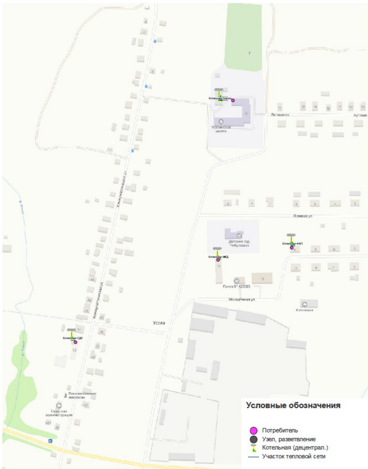
Схема теплоснабжения д. Усола