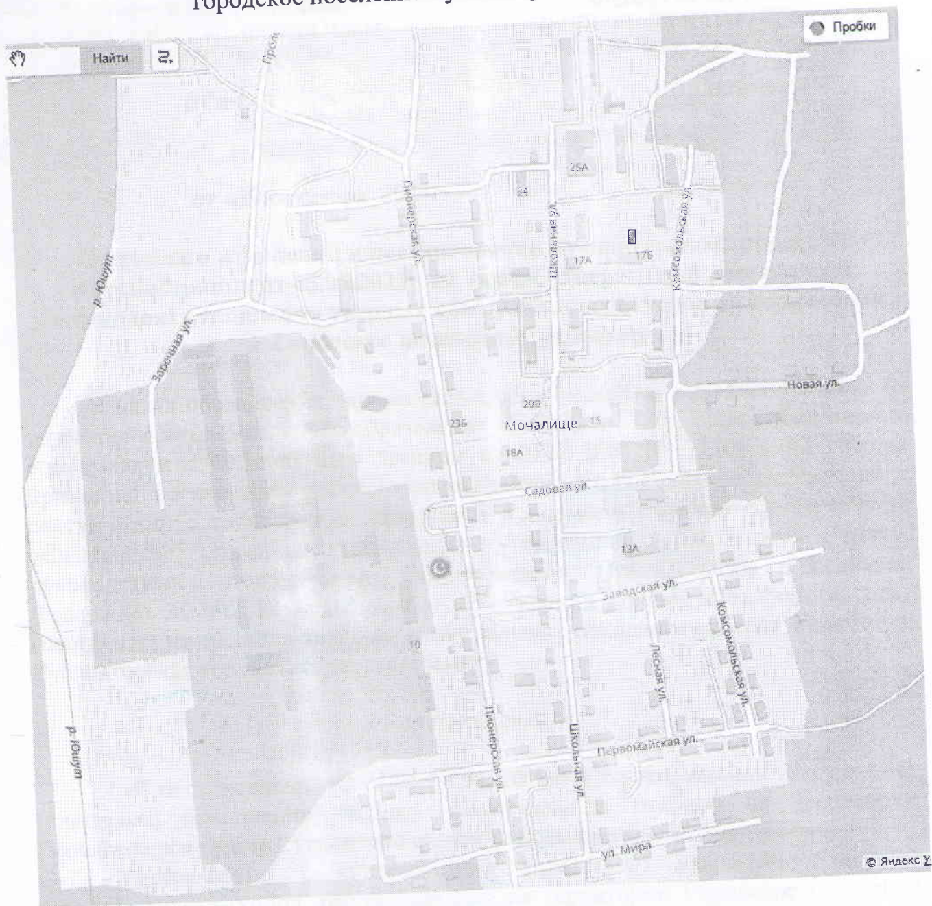
Схема размещения мест (площадок) накопления твердых коммунальных отходов на территории городское поселение Суслонгер п. Мочалище