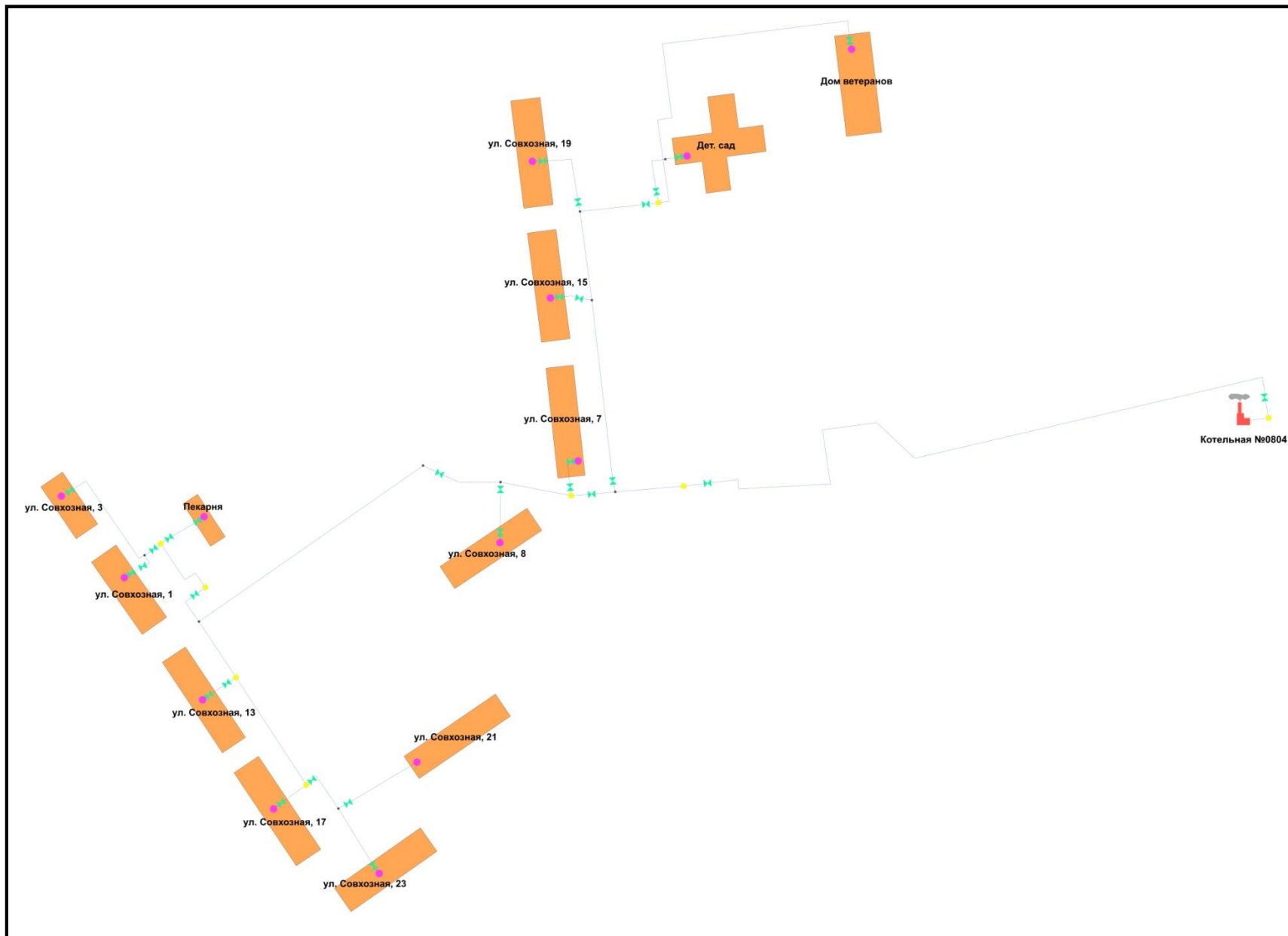
Рис.2 - Карта тепловых сетей в зоне действия котельной №0804