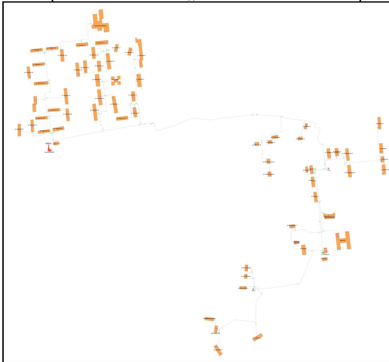
Рис.1 - Карта тепловых сетей в зоне действия котельной №0801