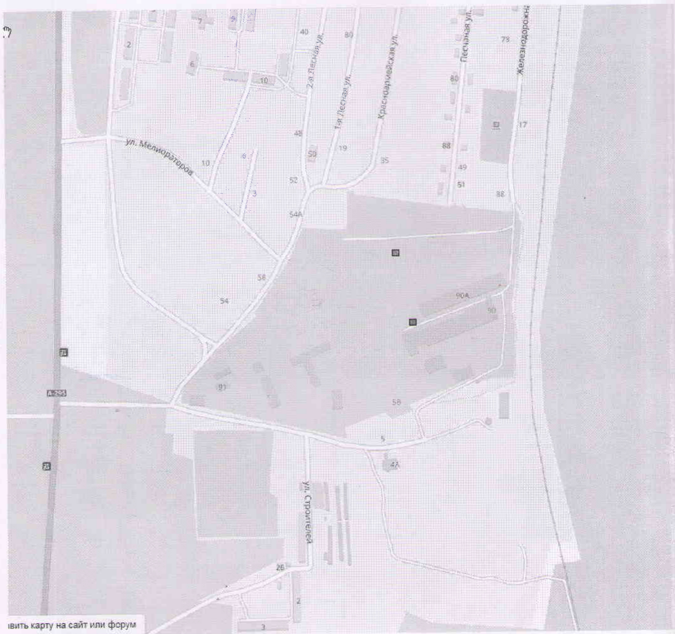
Схема размещения мест (площадок) накопления твердых коммунальных отходов на территории городское поселение Суслонгер, пгт. Суслонгер